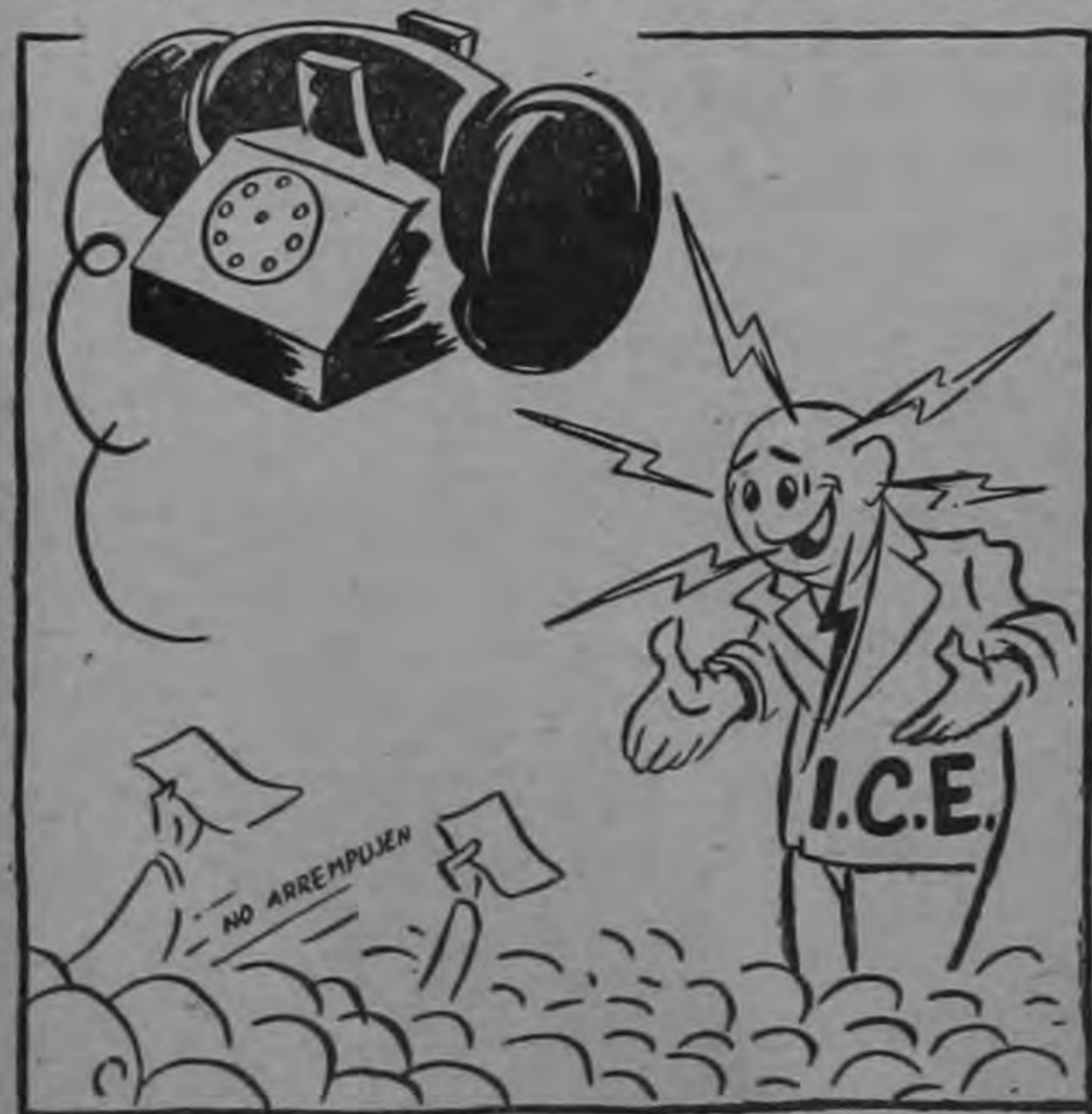
Hasta ahora, 24 mil colones en sólo soñarlos